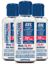
ALCOOL GEL 70 12X54GR COPERALCOOL HIGIE. BACFREE SORTIDOS PERFU.

CÓD. INTERNO 136562 BARRA CAIXA 17896090700926