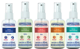
ALCOOL SPRAY 12X60ML BACFREE ANTISSEPTICO SORTIDOS PERFUMADO

CÓD. INTERNO 136565 BARRA CAIXA 17896090704405